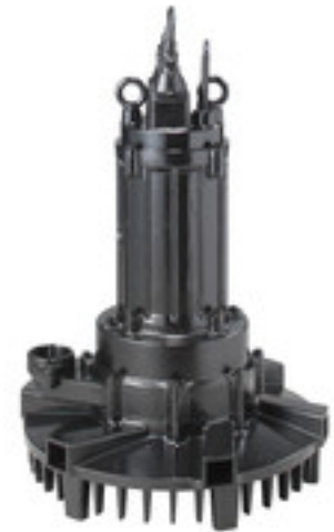
Potapajući aeratori - samousisni - laki za održavanje - laki za postavljanje