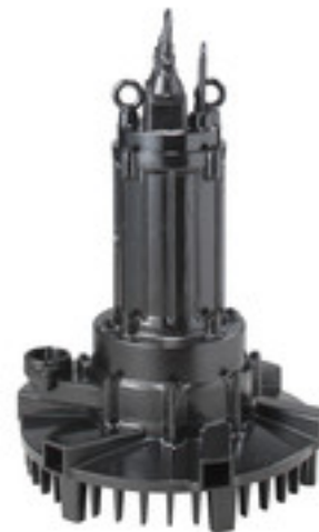
Potapajući aeratori - samousisni - laki za održavanje - laki za postavljanje